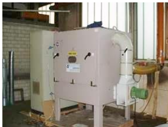
Abb. 1: Bild einer bestehenden Anlage

Benutzerfreundlichkeit, hohe Sicherheit, Zuverlässigkeit und Lebensdauer von Verschleißkomponenten zeichnet das NTP-Plasma aus. Kundenzufriedenheit ist uns wichtig, daher bieten wir auf den speziellen Anwendungsfall zugeschnittene Lösungen an.